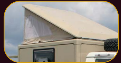
Elemente des Maltexplorer 79 im Blickpunkt

Optimierte Sandblechhalter an der Fahrzeugseite und LED Rückleuchten mit Schutzbügel aus Edelstahl runden das Erscheinungsbild des Fahrzeugs ab.